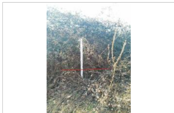
Laisse d'inondation dans la végétation