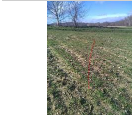
Bord du chemin agricole près de la D626

Coordonnées WGS84 : X: 1.92458054 / Y: 43.08546720