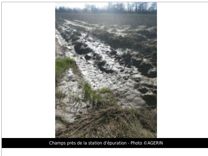
Champs près de la station d'épuration