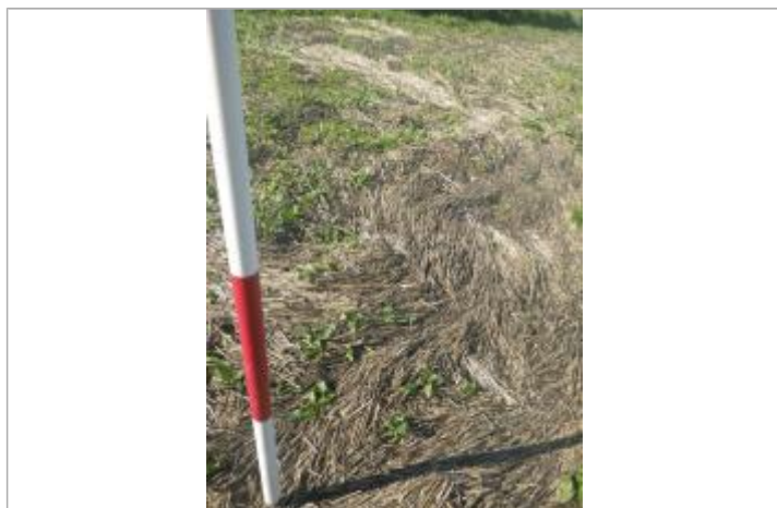
Débris végétaux au sol

Altitude calculée de l'eau (en m) : 270.67