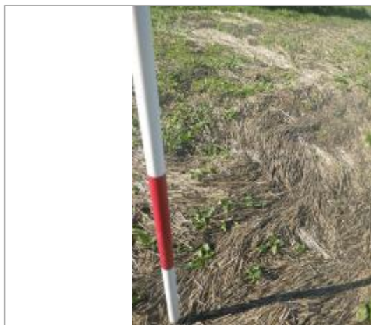
Débris végétaux au sol