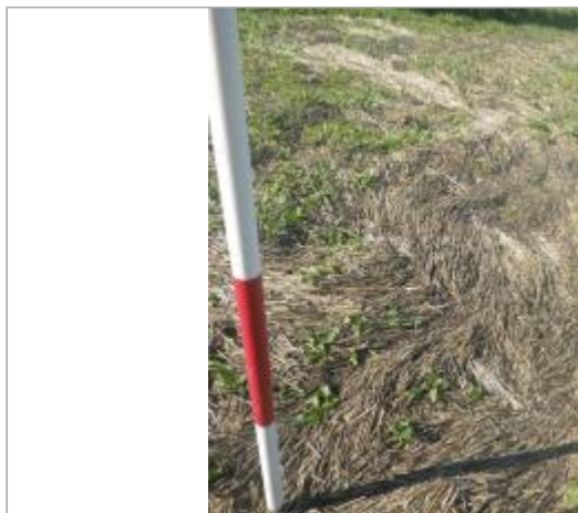
Lieu-dit Ricardel

Coordonnées WGS84 : X: 1.77081391 / Y: 43.08410890