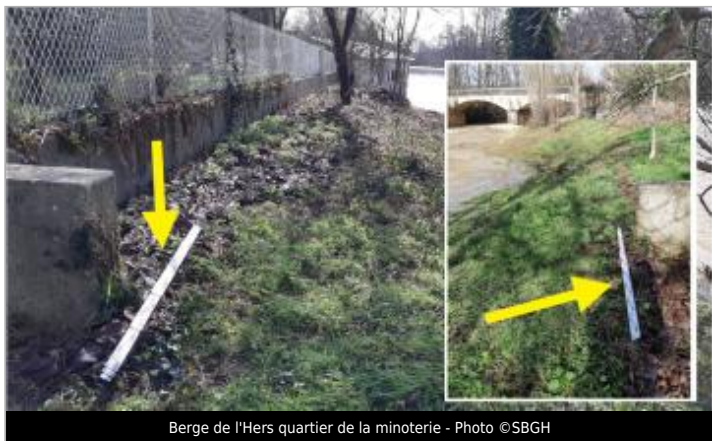
Berge de l'Hers quartier de la minoterie

GÉOLOCALISATION Coordonnées WGS84 : X: 1.94365456 / Y: 43.07340580 Coordonnées RGF93 (Lambert 93) X: 613899.37 / Y: 6219921.52 Coordonnées RGF93 (ETRS89) : X: 1.9436546 / Y: 43.0734058 Code Hydro: O1--0290 Rive de référence: Droite