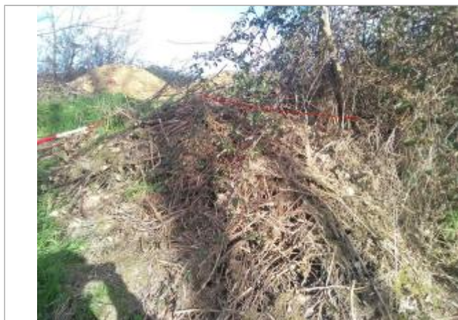
Débris végétaux en haut de berge

Altitude calculée de l'eau (en m) : 312.29