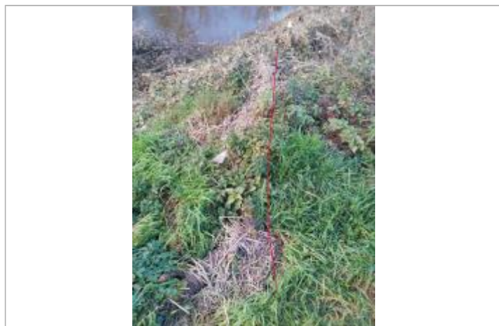
Débris végétaux en haut de berge

Altitude calculée de l'eau (en m) : 313.24