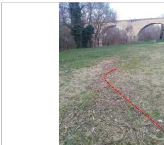
Prairie au bord de l'Hers

Coordonnées WGS84 : X: 1.94408334 / Y: 43.07598700