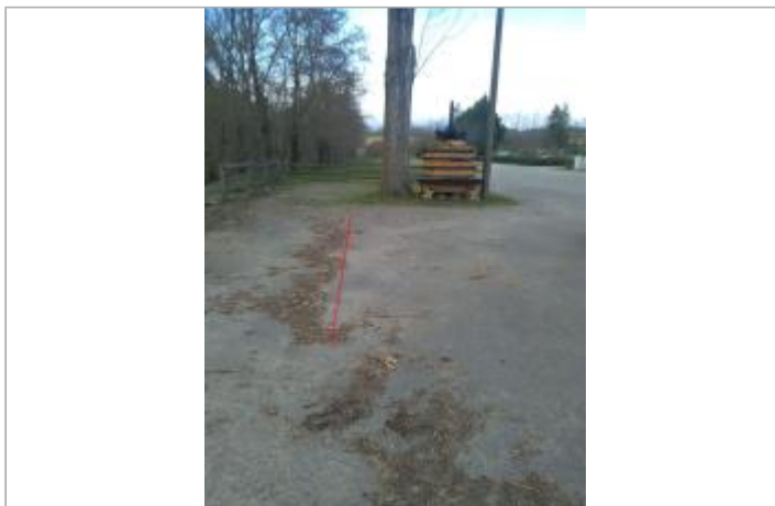
Parking de la salle des fêtes