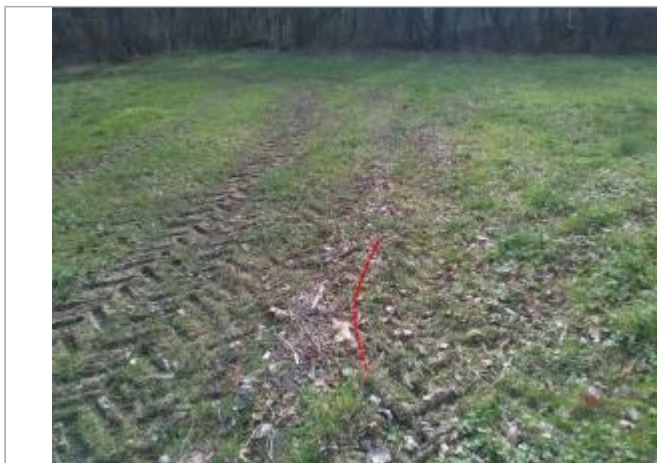
Champs au bord de la D507

Coordonnées WGS84 : X: 1.93295634 / Y: 43.06140590