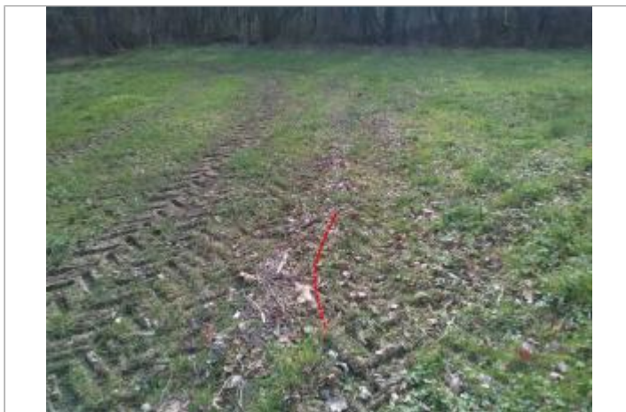
Champs au bord de la D507