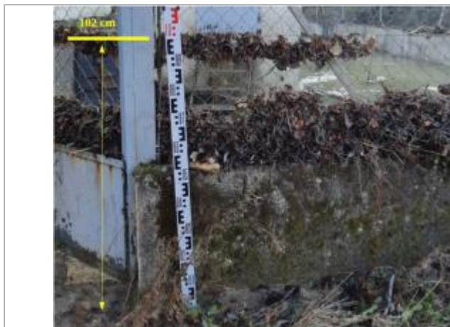
Grillage de la station AEP