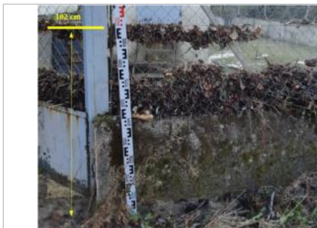
Laisse de crue sur le grillage

Différence entre le niveau d'eau et la référence (en m) : 1.020 m