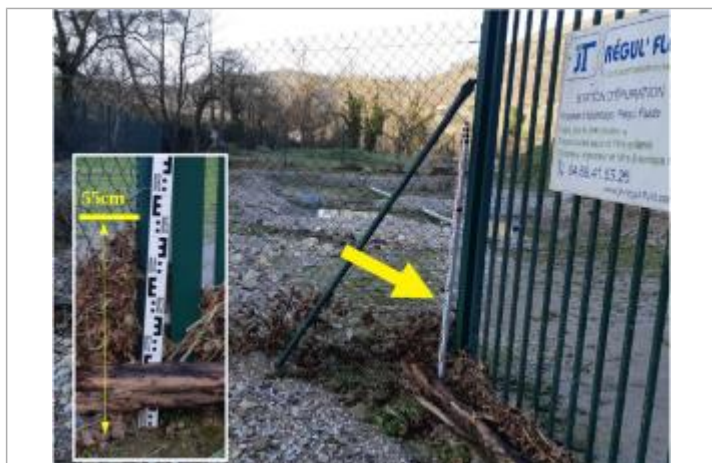
Laisse de crue sur le grillage