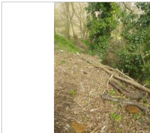
Berge rive gauche aval du pont de Mirepoix