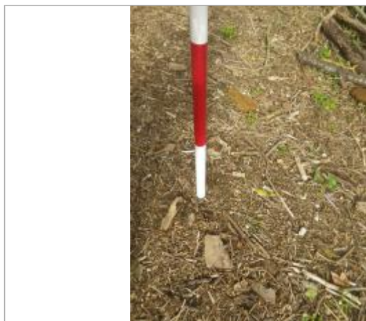
Débris végétaux au sol