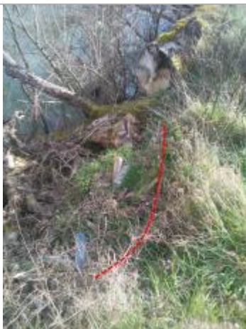
Débris en haut de berge