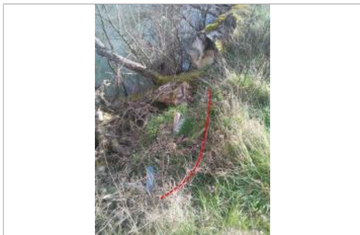
Débris en haut de berge

Altitude calculée de l'eau (en m) : 296.82