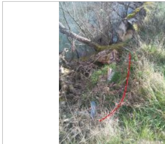
Berge de la gravière

Coordonnées WGS84 : X: 1.88777060 / Y: 43.09335370