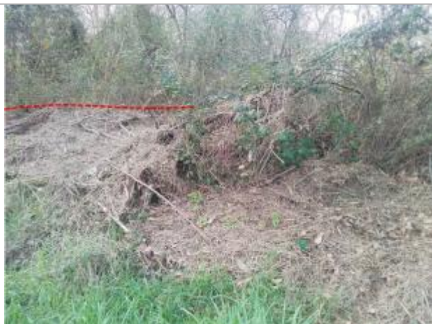
Laisse d'inondation dans végétation

Altitude calculée de l'eau (en m) : 294.95