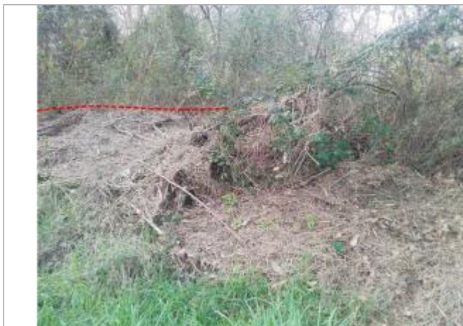
Berge rive droite aval du pont Mirepoix