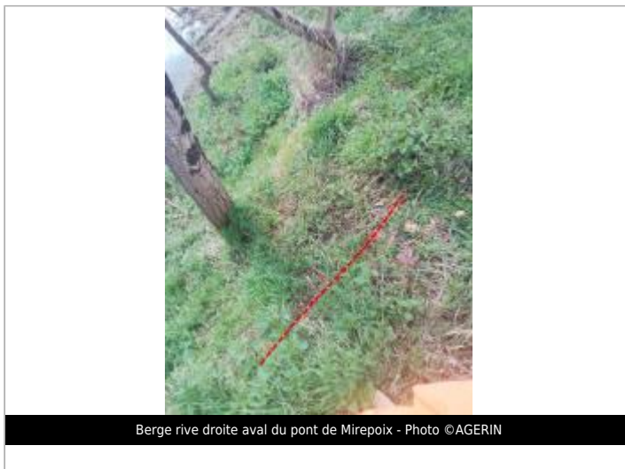
Berge rive droite aval du pont de Mirepoix