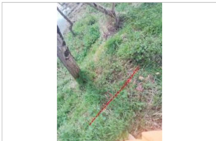
Débris végétaux en haut de berge - Photo ©AGERIN

Altitude calculée de l'eau (en m) : 294.57