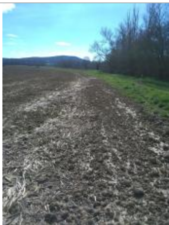
Débris végétaux au sol