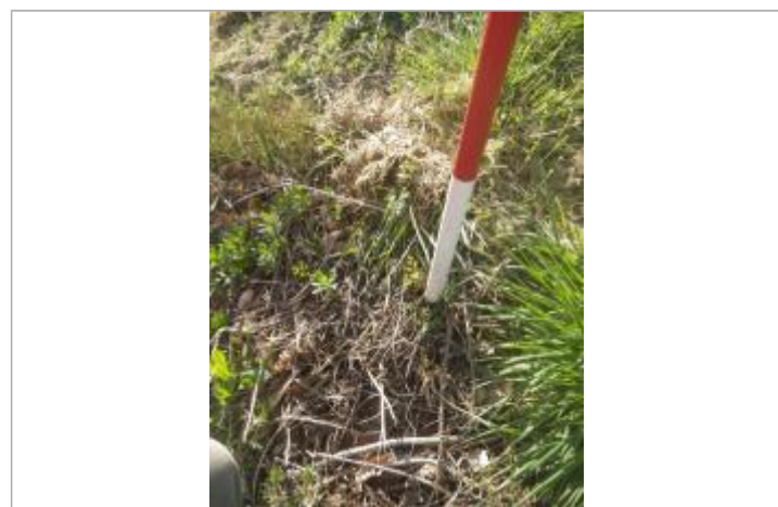
Débris végétaux haut du talus

GÉNÉRAL Code : GTL_R_9920_1 Date de mise à jour : 19/10/2020 Auteur : SPC GTL