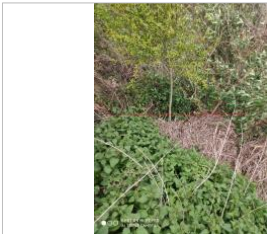
Débris végétaux sur le talus