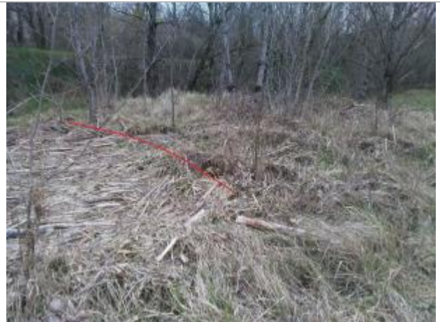
Terrain agricole en rive gauche

Coordonnées WGS84 : X: 1.94142999 / Y: 43.04808910