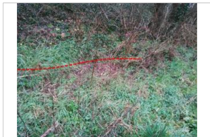
Débris végétaux sur la digue

GÉNÉRAL Code : GTL_R_9915_1 Date de mise à jour : 28/09/2020 Auteur : SPC GTL