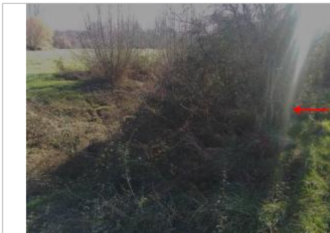
Végétation au bord de la D207