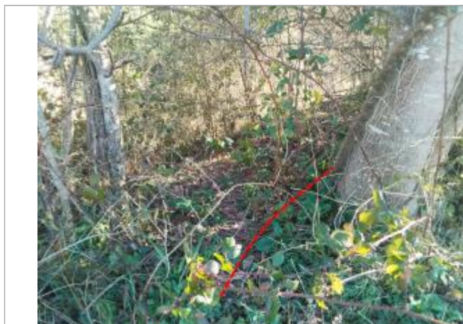
Débris végétaux en haut de talus