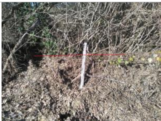
Laisse de crue dans la végétation

Altitude calculée de l'eau (en m) : 327.62