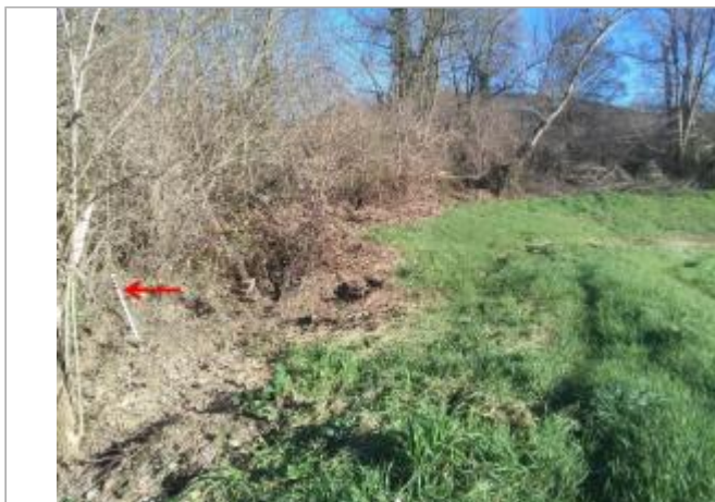
Taillis en bord de champs

Coordonnées WGS84 : X: 1.93331323 / Y: 43.04151360