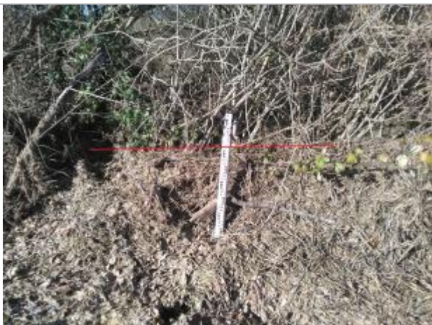
Laisse de crue dans la végétation

Altitude calculée de l'eau (en m) : 327.62