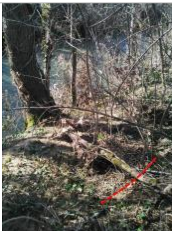
Débris végétaux en haut de berge