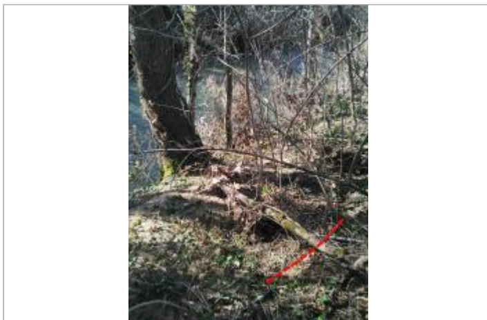
Berges rive droite - Photo ©AGERIN