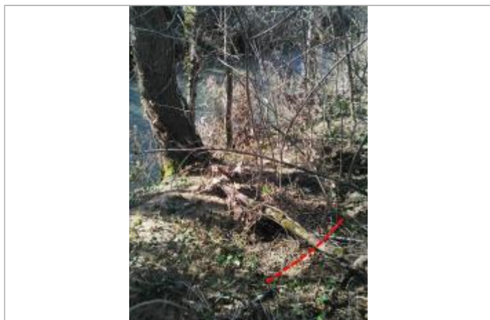
Débris végétaux en haut de berge - Photo ©AGERIN

Altitude calculée de l'eau (en m) : 332.32