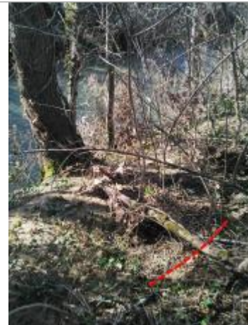
Berges rive droite