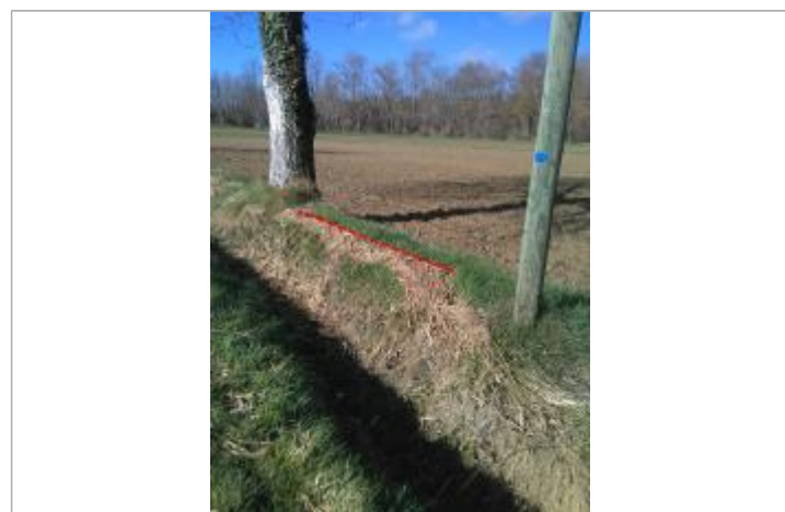
Laisse d'inondation bord de fossé