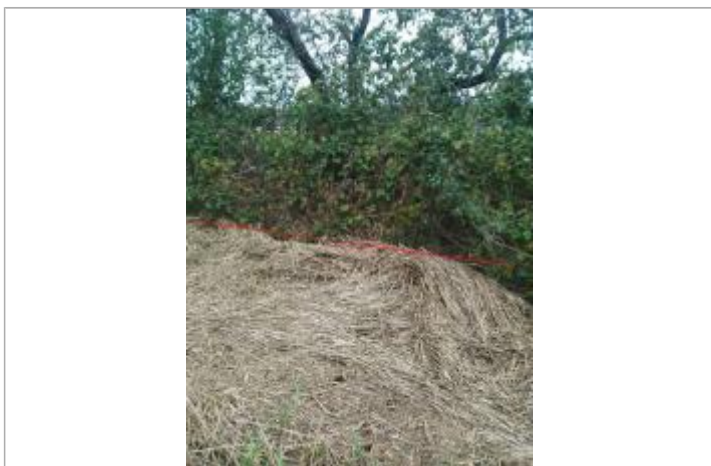
Débris végétaux dans une haie