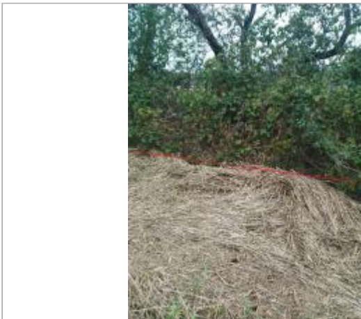
Haie en limite de parcelle