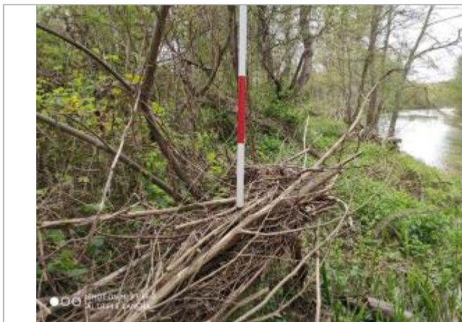
Berge rive gauche de l'Hers