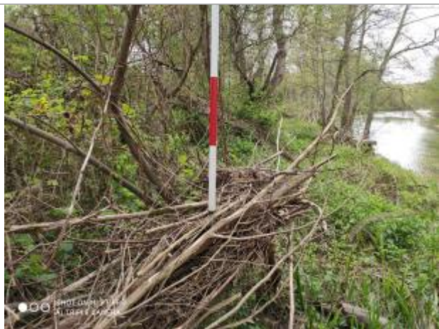
Débris végétaux sur le bord de l'Hers

Altitude calculée de l'eau (en m) : 280.6