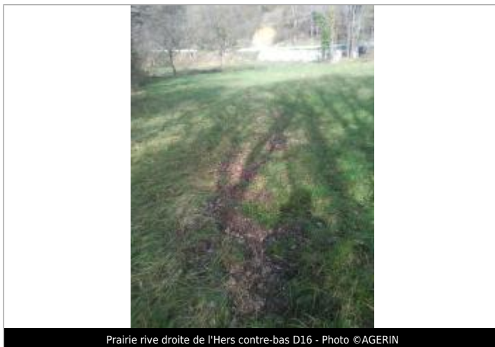
Prairie rive droite de l'Hers contre-bas D16