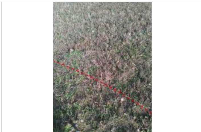
Champs rive gauche

Coordonnées WGS84 : X: 2.00038410 / Y: 42.98890000