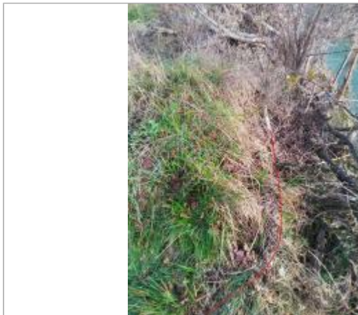
Berge rive gauche - Photo ©AGERIN

Coordonnées WGS84 : X: 2.00060577 / Y: 42.98863070