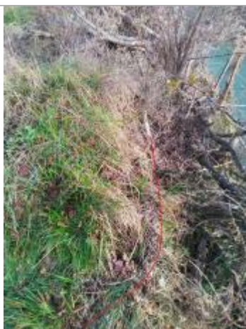
Débris végétaux berge