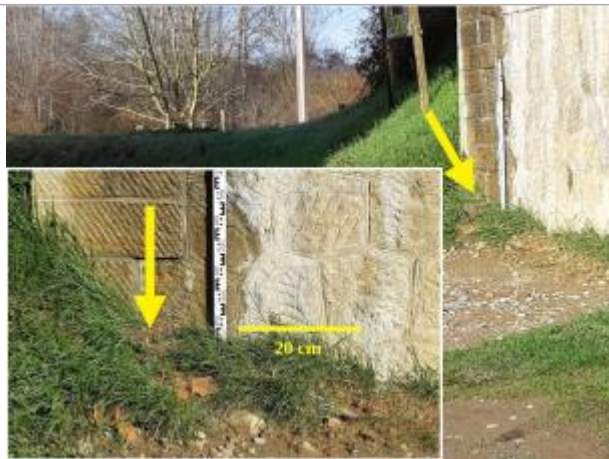
Pile de droite du pont de la voie verte