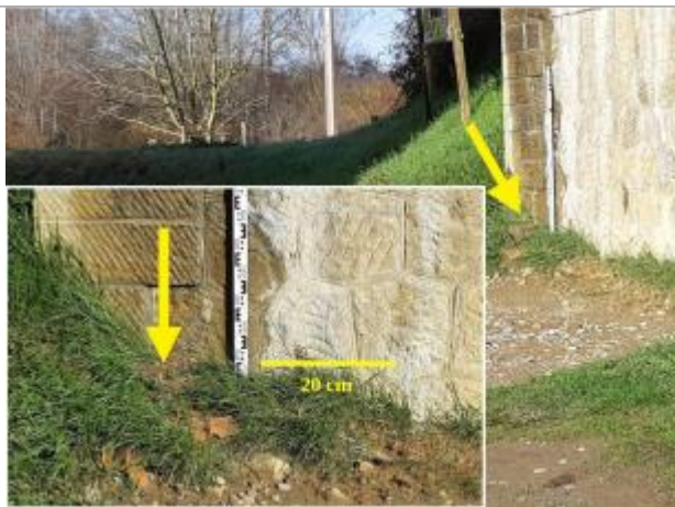
Laisse de crue sur la pile du pont