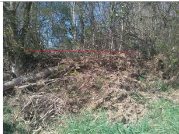
Végétation rive droite