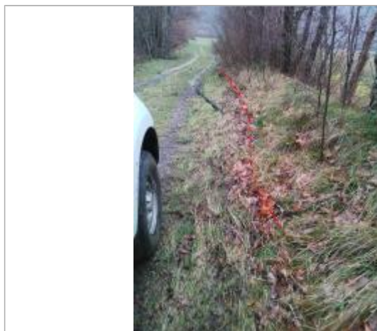
Débris végétaux talus