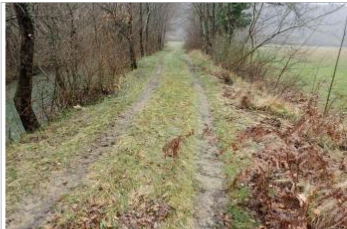
Berge rive droite