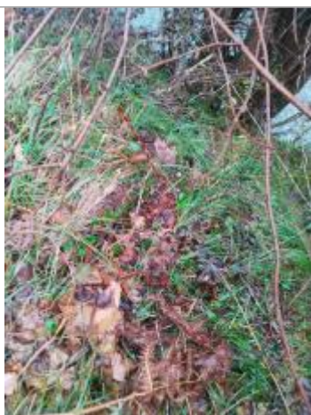
Débris végétaux berges