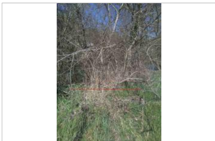
Débris végétaux berges

Code : GTL_R_9839_1 Date de mise à jour : 25/09/2020 Auteur : SPC GTL