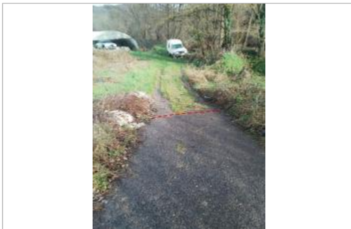
Chemin accès rive droite