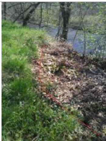
Débris végétaux berge

Altitude calculée de l'eau (en m) : 340.44