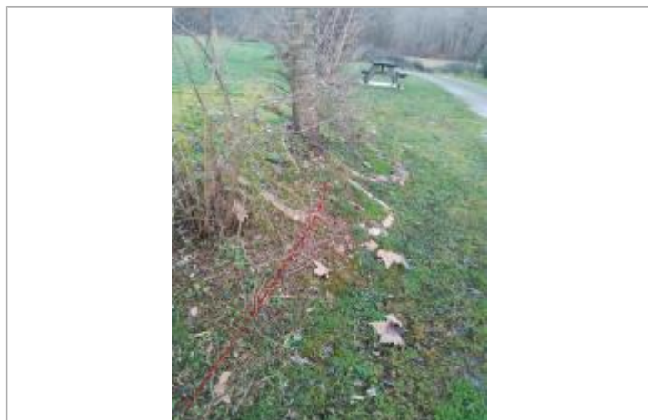
Débris végétaux sur sol