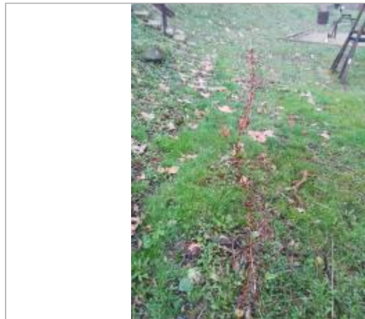
Aire de jeux - Photo ©AGERIN