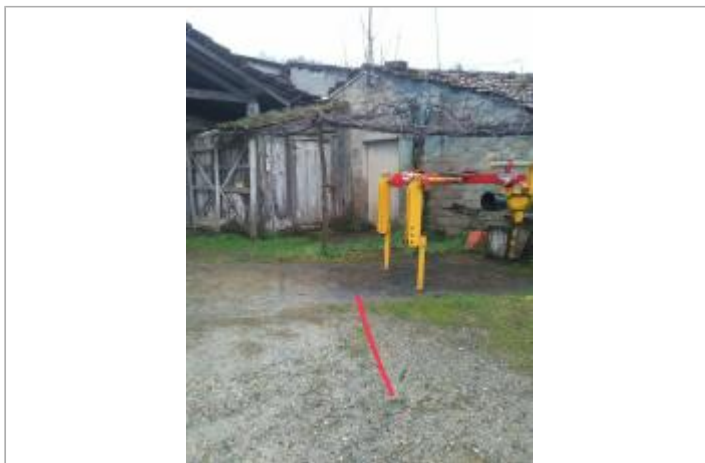
Chemin des vaches