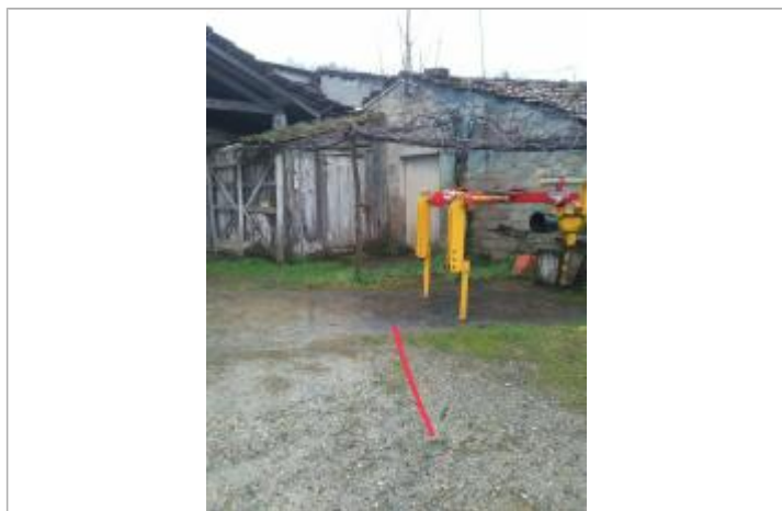
Temoignage chemin des vaches