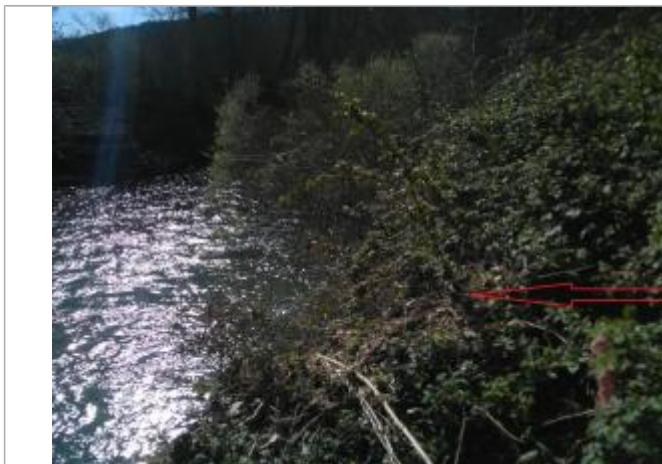
Débris végétaux sur végétation