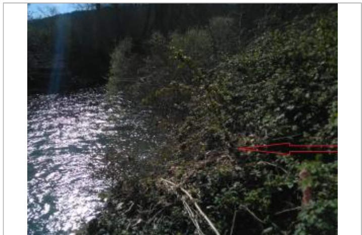
Débris végétaux sur végétation

GÉNÉRAL Code : GTL_R_9818_1 Date de mise à jour : 04/09/2020 Auteur : SPC GTL