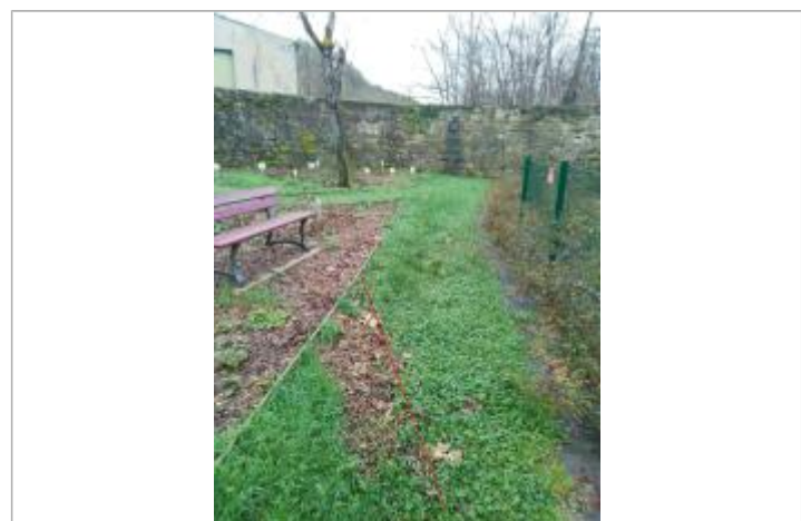
Débris végétaux sur sol

GÉNÉRAL Code : GTL_R_9815_1 Date de mise à jour : 04/09/2020 Auteur : SPC GTL