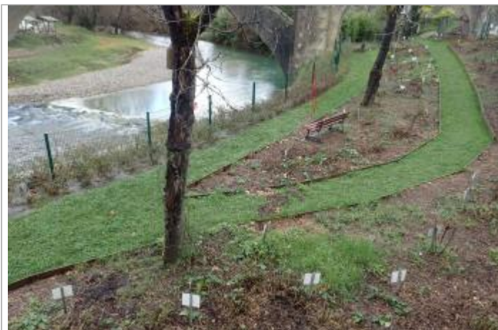
Berge rive gauche