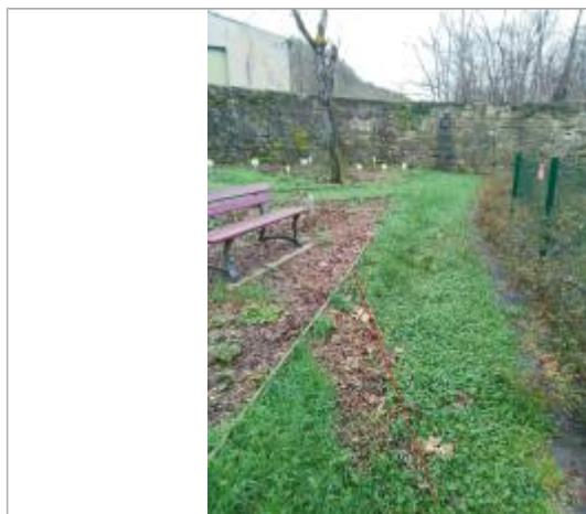
Débris végétaux sur sol