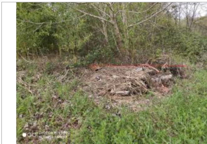
Rive gauche