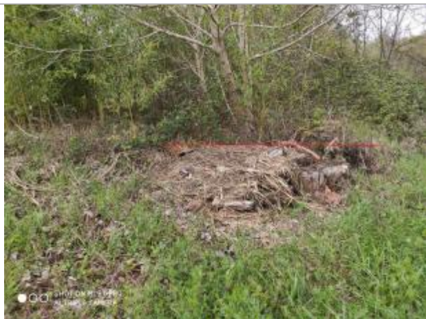
Débris végétaux sur sol

Altitude calculée de l'eau (en m) : 283.43