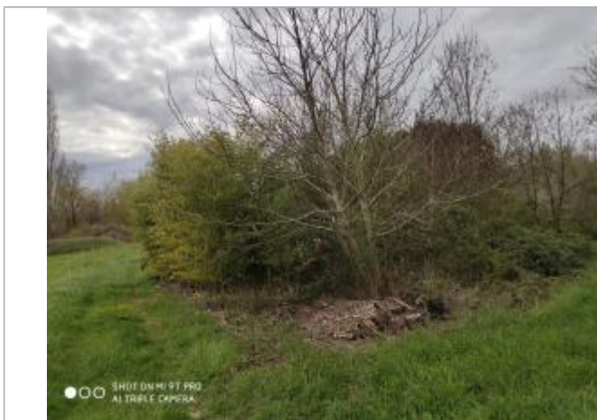
Débris végétaux sur sol