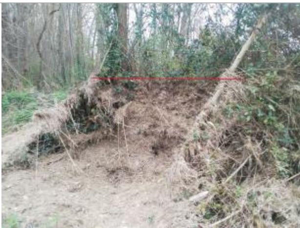
Débris végétaux sur végétation

Altitude calculée de l'eau (en m) : 286.05