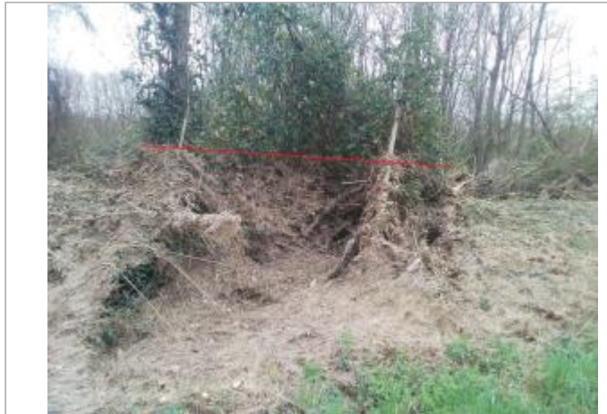
Bord route de Manses

Coordonnées WGS84 : X: 1.83181747 / Y: 43.08615450