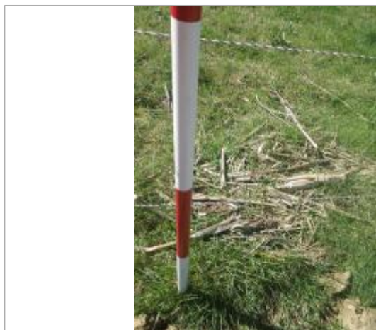
Débris végétaux au sol