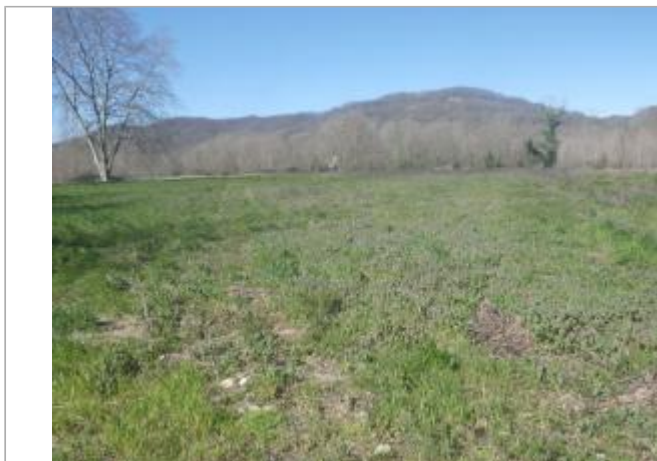
Rive gauche

Coordonnées WGS84 : X: 1.84623493 / Y: 43.08672590