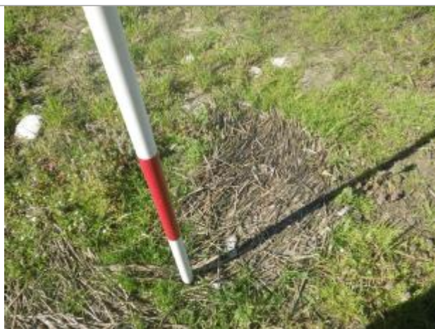
Débris végétaux sur sol