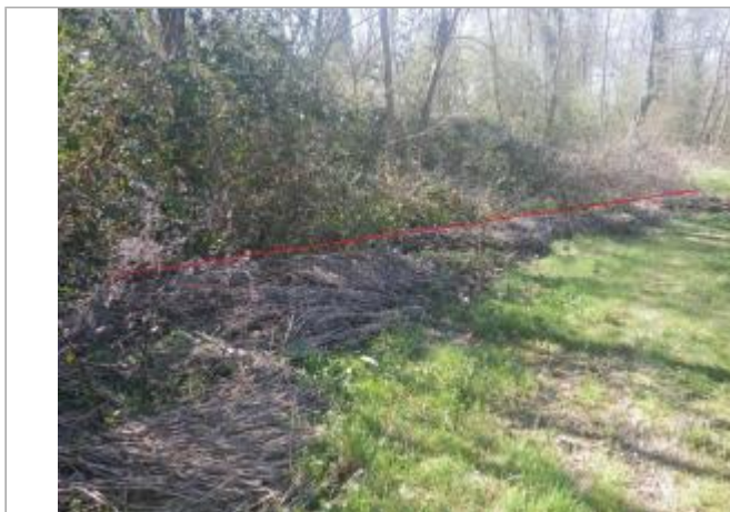
Rive gauche

Coordonnées WGS84 : X: 1.84650264 / Y: 43.08673110