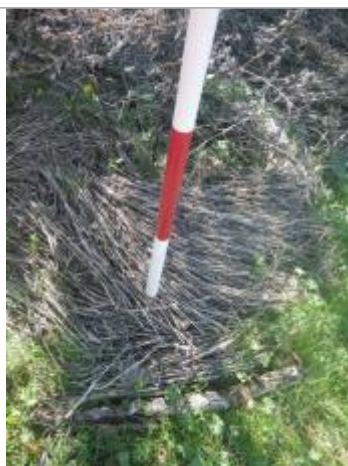
Débris végétaux sur sol