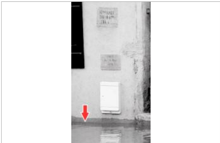
Photographie pendant la crue

MARQUE Maximum de l'inondation : Non renseigné Visibilité : Oui État du repère : Disparu Pérennité : Aucune Repère calculé : Non PHEC : Non