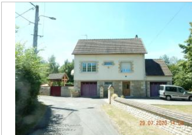
2 rue Réage Saint Benoit